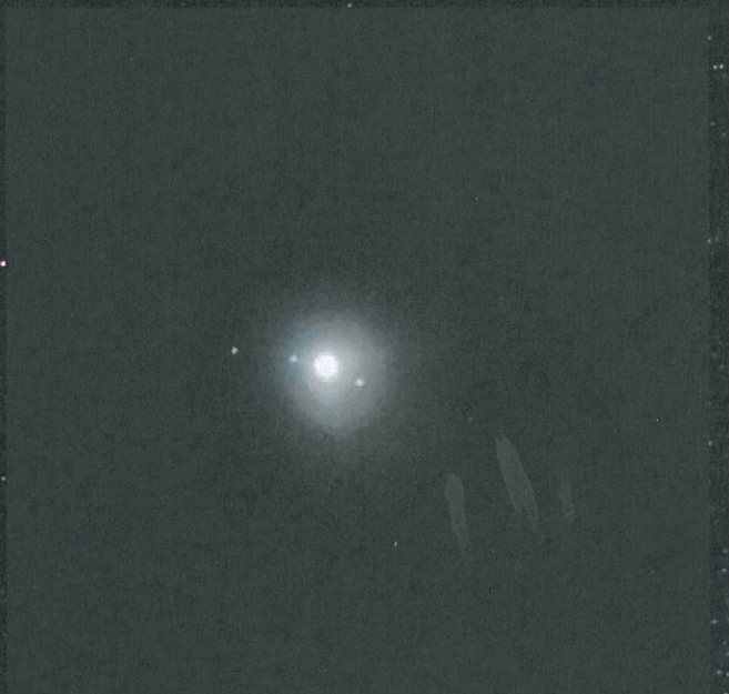
Jupiter et ses satellites