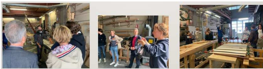
Bardonecchia (TO) - Falegnameria Davide Arlaud