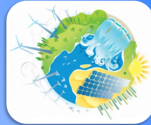
Technologie des énergies

Sur les plans scientifiques et technologiques, le titulaire du baccalauréat STI2D sera détenteur de compétences étendues car liées à un corpus de connaissances des trois domaines « Matière – Énergie – Information », suffisantes pour lui permettre d'accéder à la diversité des formations scientifiques de l'enseignement supérieur :