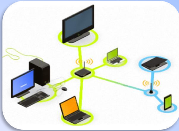
Technologie de l'information

Le Bac STI2D permet, dans le cadre de travaux pratiques, d'analyser le fonctionnement et la structure de solutions technologiques.