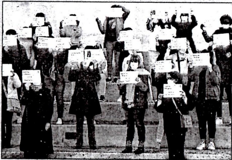
Au lycée Francis-de-Croisset, un rassemblement en mémoire des victimes de féminicides a eu lieu.

instrument de mesure pour une relation amoureuse basée sur le consentement et sans violences) et les numéros utiles et structures d'accueil vont être distribués aux élèves. Les halls des lycées afficheront le nom des victimes de féminicides et un rassemblement aura lieu à 10 h. Le lycée Tocqueville organisera une manifestation similaire jeudi.