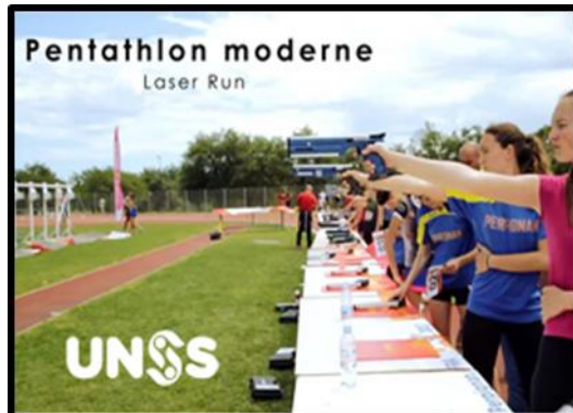
1 ère promotion 2019