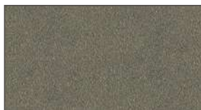
Antracite sable ★★ 960