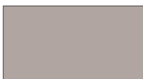
Gris fusain RAL 7042 - 735