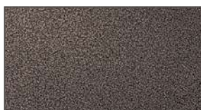
Black Copper ▲★ 978