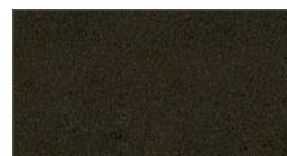
Brun sable ★★ 961