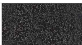
Noir décor ▲ 847