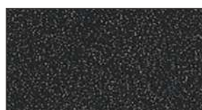
Noir grainé ★ 862