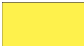
Jaune RAL 1018 - 714