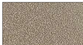
Vison grainé ★ 861