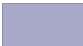
Bleu texturé 792