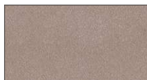
Gris métal * 962