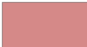
Rose anglais RAL 3015 - 890