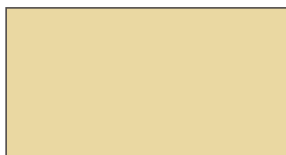
Ivoire ● RAL 1015 - 986