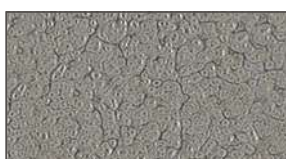
Gris martelé ▲ 814