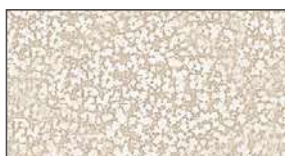
Blanc martelé ▲ 952