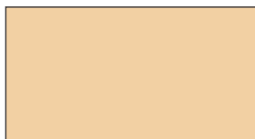
Rose toscan 817