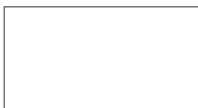
Blanc RAL 9016 - 816