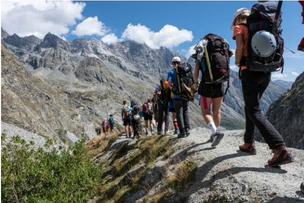
séjour intégration préentré – glacier blanc