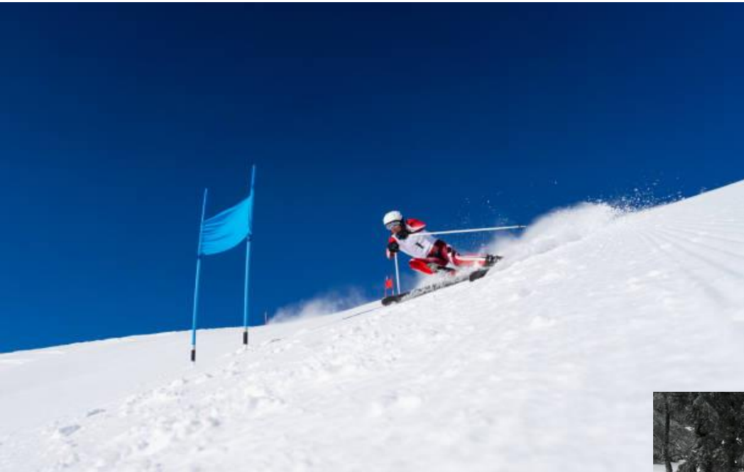
ALPIN MONITEUR / PISTEUR